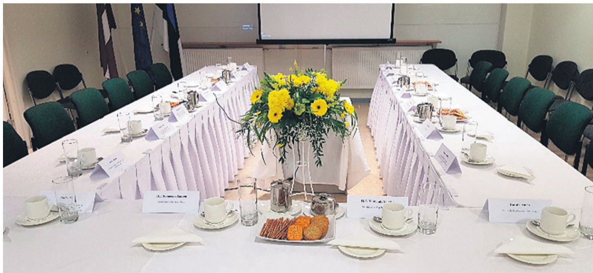
Ettevalmistused Läti Presidendi vastuvõtuks.

Järvamaa Kutsehariduskeskuse täienduskoolituse meeskond