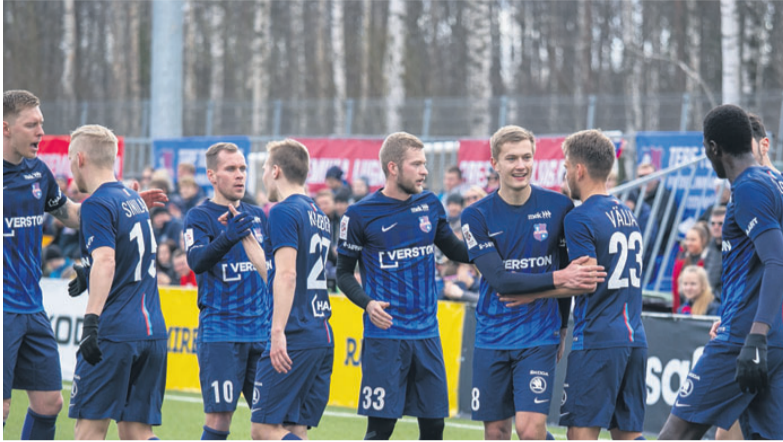
Meeskond esimest koduväravat tähistamas.

Paide LM U21 hooaeg esiliiga B-s algas võidukalt, kui võõrsil alistati Viimsi JK 1:0. Teises voorus pidid poisid tunnustama koduväljakul FC Nõmme United paremust 6:0. Kolmandas ja neljandas mängus said poi-