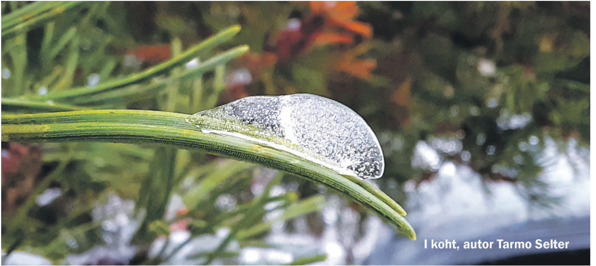
I koht, autor Tarmo Selter