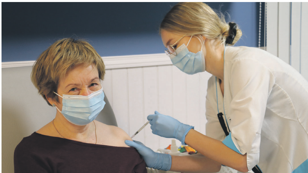
Fotojäädvustus perearstide vaktsineerimisest 26. jaanuaril