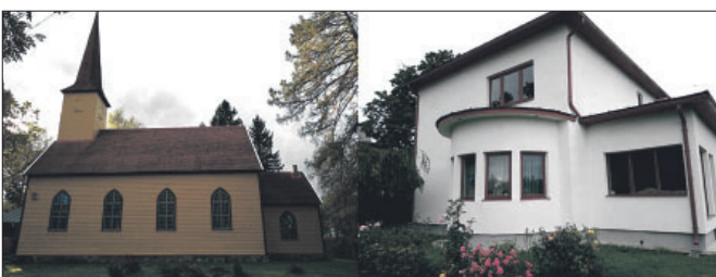
Hoonete renoveerimistööd. Projektijuhtimine info@puidukaubandus 5533656 Runda meistrid OÜ