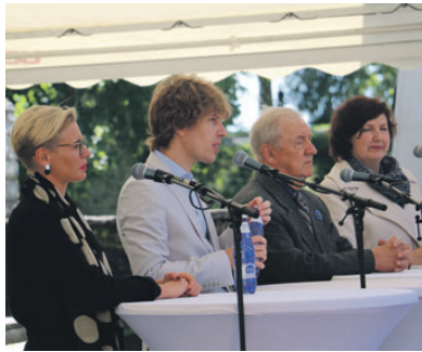
Festival Hingelt Noored

Augustikuu esimesel reedel toimub Paide vallimäel järjelt teine vanemaaliste festival Hingelt Noored. Ka sel aastal on plaanis arutelud pävakajalistel teemadel poliitikute ja oma ala spetsialistidega. Uue elemendina leiab festivali kavast eri maakondade kultuurikollektiivide esinemised, mille jaoks luuakse eraldi kultuurilava. Samuti leiab alalt mitmeid teema- ja müügitelke. Festivalile on oodata ka peaesinejat, keda korraldaja hetkel veel avalikustanud ei ole.